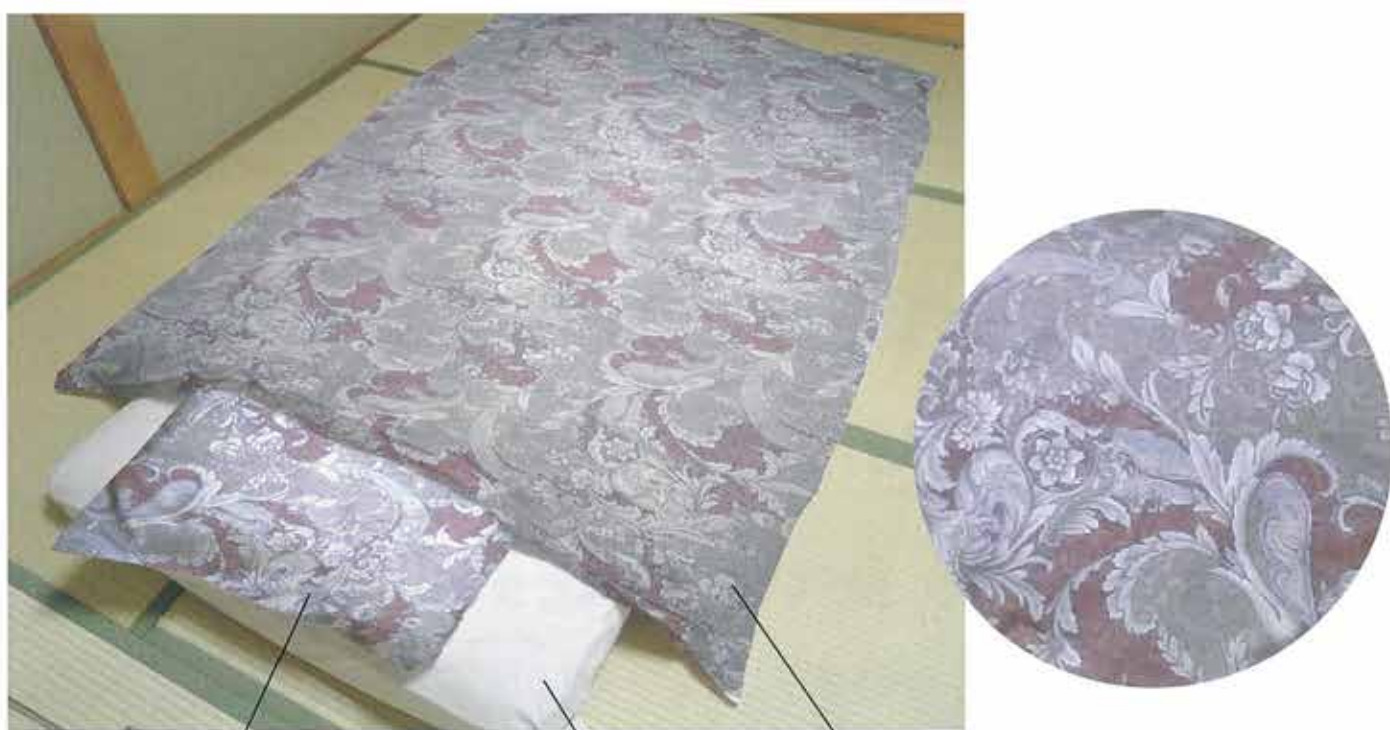
枕カバー 敷カバー 掛カバー